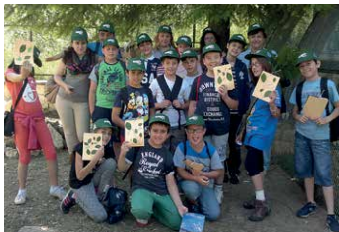
Attività didattiche nel Parco del Gran Sasso: Classe "Fagus Museo".

T ra le azioni di sensibilizzazione previste dal progetto vi sono le attività didattiche che hanno l'obiettivo di promuovere la conoscenza degli habitat e delle specie di interesse comunitario, con particolare riferimento a quelle obiettivo dell'intervento, presenti nei siti della Rete Natura 2000 dei due Parchi nazionali.