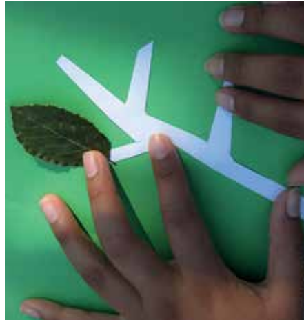
Attività didattiche nel Parco del Gran Sasso: Librino Fagus