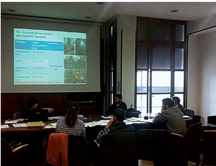
Uno dei vari Incontri finalizzati alla discussione dei progetti preliminari.

In seguito a questa fase sono stati redatti i progetti esecutivi per i quali è stato completato o è in corso di completamento l'iter autorizzativo e, per alcuni interventi, è stata avviata la procedura di affidamento dei lavori.