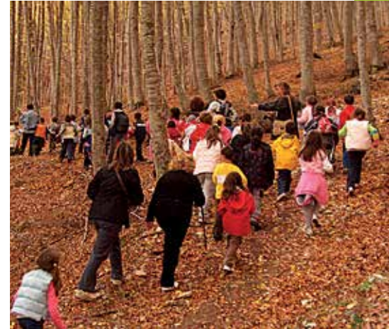
Attività didattiche nel Parco del Gran Sasso: escursione Faggeta.

Quasi 800 tra studenti e insegnanti hanno potuto conoscere e fare esperienza diretta negli ambienti forestali attraverso un metodo multidisciplinare tipico dell'educazione ambientale. Gli operatori del CEA del Parco hanno "guidato" il percorso con passeggiate, laboratori, giochi di gruppo, rielaborazioni e approfondimenti per scoprire la grande importanza degli alberi e del Faggio in particolare per la conservazione della