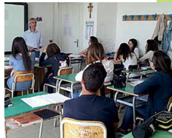
Attività didattiche nel Parco del Cilento: la classe III B di Buonabitacolo (SA).

Dei tre incontri effettuati per ogni classe, il primo (in aula) ha previsto una presentazione del progetto e delle attività teoriche sulle foreste di faggio in genere e sulle faggete presenti nel territorio del Parco.