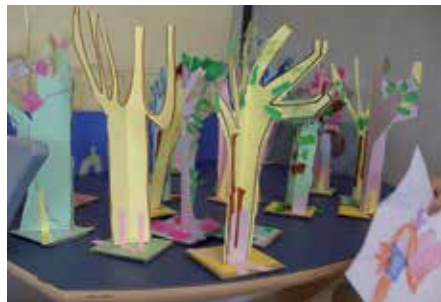
Attività didattiche nel Parco del Gran Sasso: Bosco di carta