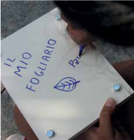
Attività didattiche nel Parco del Gran Sasso: Il mio Fogliario