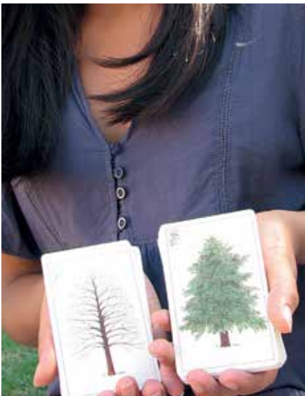
Attività didattiche nel Parco del Gran Sasso: Gioco Carte degli alberi.

Sulla base di un programma didattico elaborato dall'Ente Parco, le attività di educazione ambientale sono state curate dagli esperti della Cooperativa Antea, composta dalle Guide Ufficiali ed Esclusive del Parco che, durante gli incontri con gli studenti, hanno trattato i temi dell'ecosostenibilità, della biodiversità e della salvaguardia degli ecosistemi con specifico riferimento a specie e habitat obiettivo del progetto.