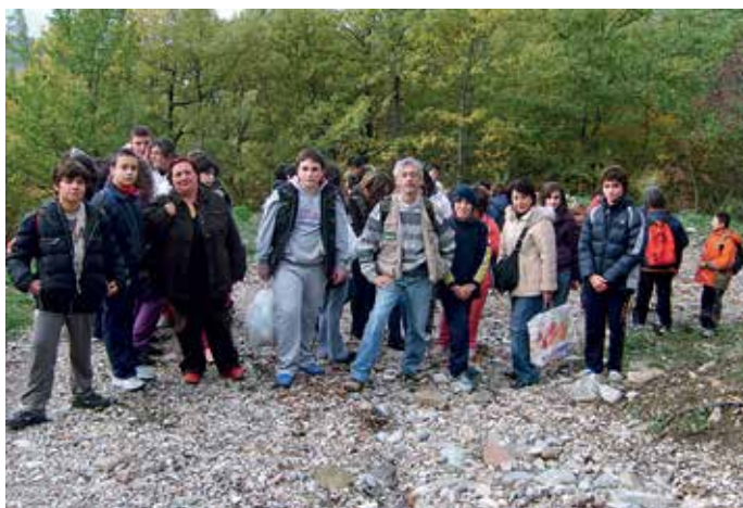
Attività didattiche nel Parco del Cilento: la classe III A di Buonabitacolo (SA).