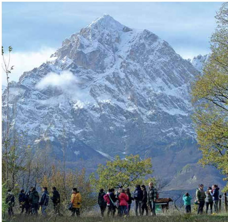
Attività didattiche nel Parco del Gran Sasso: escursione Sentiero Natura San Pietro.

Nell'anno scolastico che si è appena concluso, infatti sono state oltre 20 le scuole primarie e medie che hanno raccolto l'invito dell'Ente Parco a conoscere da vicino il grande patrimonio di biodiversità costituito dalle faggete presenti ai diversi angoli del territorio montano: dalle faggete del Voltigno alla Macchia di San Pietro, dal Bosco di Santa Colomba alla Selva degli Abeti di Tossicia.